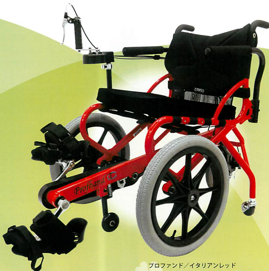
プロファンド/イタリアンレッド メーカー希望小売価格：309,100円(非課税) 商品コード：PR000001H