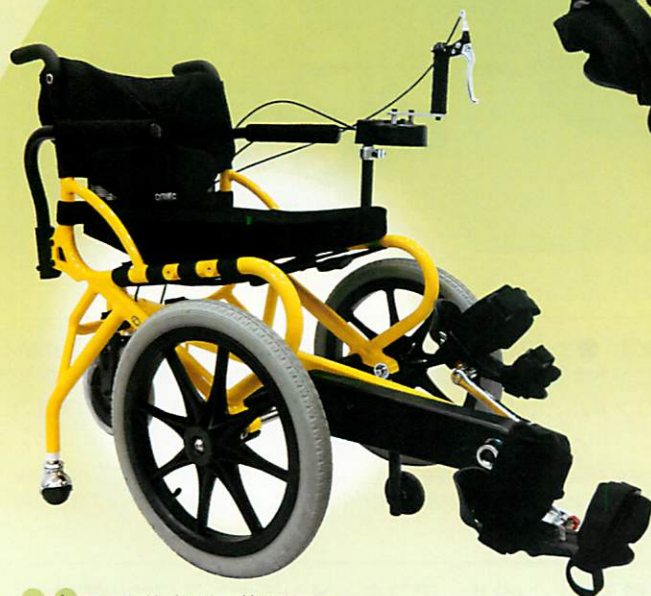
プロファンド/ソリッドイエロー メーカー希望小売価格：309,100円(非課税) 商品コード：PR000002H